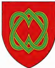
BLONAY - SAINT-LÉGIER

«De gueules à deux cœurs de sinople bordés d'or évidés, entrelacés et l'un versé».